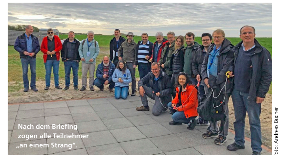
Nach dem Briefing zogen alle Teilnehmer „an einem Strang“.

Mehr Infos unter www.daec.de/news/news-detail/flugsicherheitsseminar-auf-juist/