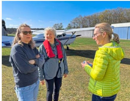
Vor dem Flug nach Helgoland werden letzte Instruktionen erteilt.

Für das jährlich stattfindende gemeinsame Sicherheitstraining der Vereinigung Deutscher Pilotinnen, VDP, mit der deutschen Sektion der „Ninety-Nines“ (99s) in Nordhorn-Lingen hatten sich die Veranstalterinnen etwas Besonderes ausgedacht. Nachdem die acht Teilnehmerinnen am Freitag und Samstag unter der Anleitung von vier Fluglehrerinnen auf drei Cessnas und zwei Piper insbesondere Kurzstart- und Kurzlandeverfahren geübt und sich mit sorgfältiger Flugvorbereitung (speziell „Weight and Balance“ sowie Start- und Landestrecken-Berechnungen) auseinandergesetzt hatten, ging's am Sonntag zur Anwendung des Gelernten nach Helgoland. Alle Crews landeten bei strahlendem Sonnenschein und nahezu Windstille sicher und souverän auf der kurzen Bahn der vorgelagerten kleinen Düne. Nach dem Besuch